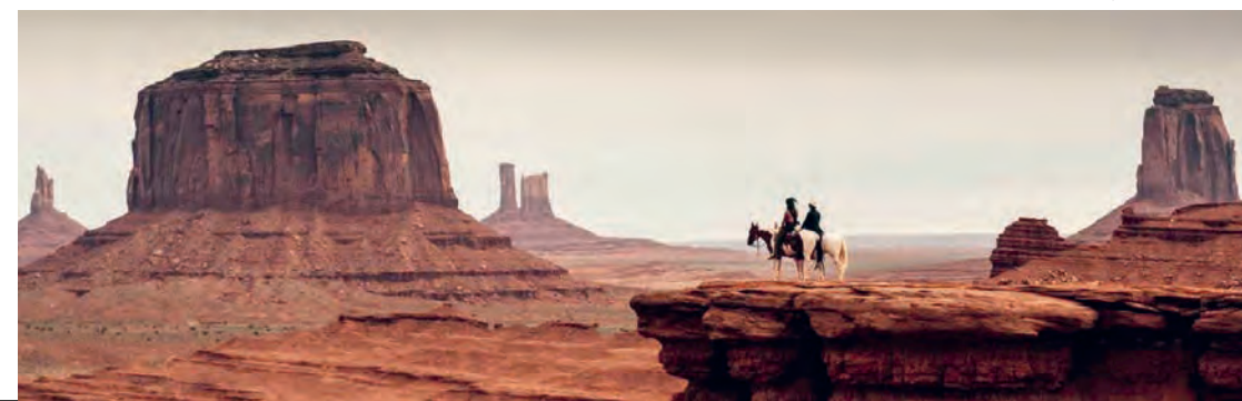
La Prisonnière du désert (The Searchers)

Les lundis 30 novembre, 7 et 14 décembre 2026, 4, 11 et 18 janvier 2027 à 14h30