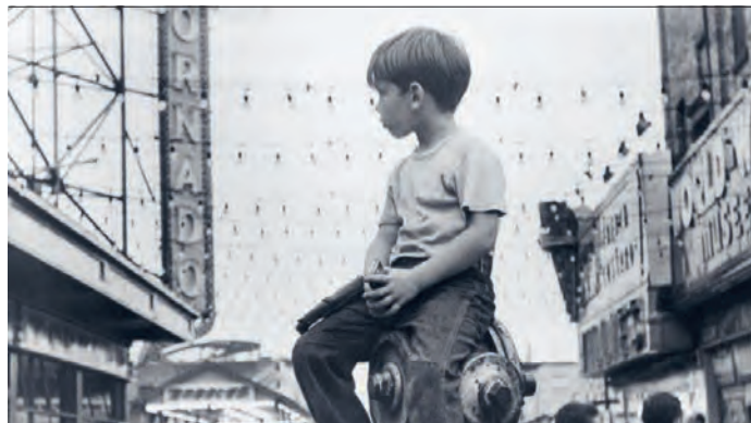
Le Petit Fugitif