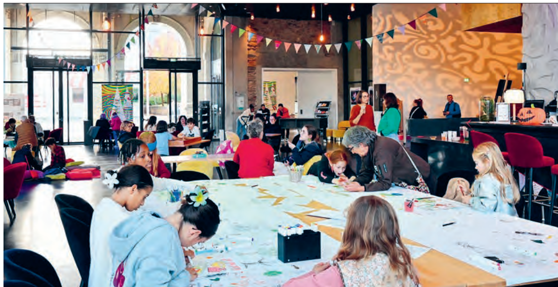
Temps fort Saut-de-mouton

Tout au long de la saison, des ateliers, stages, conférences, rencontres ou visites du Théâtre sont mises en place. Ces moments sont adaptés à chacune et chacun, en fonction de son âge et de ses envies. Certains projets s'inventent aussi avec des partenaires du territoire, structures culturelles, sociales ou associatives, en écoutant attentivement les envies et les spécificités de chacun, comme autant de passerelles possibles pour ouvrir les portes du Théâtre à toutes et tous.