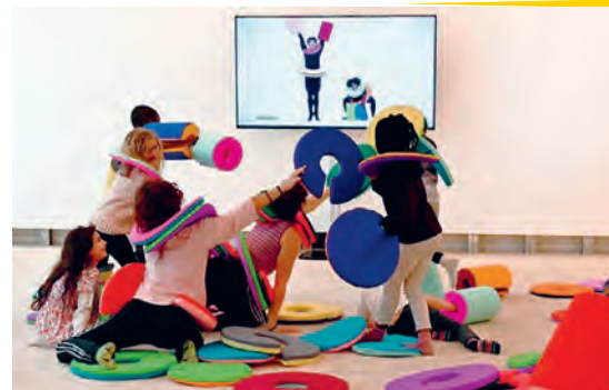
Les Tutomouves © Yvan Clédât

Durée 35 min - Tarifs 7€/5€ (réservation sur athenor.com )