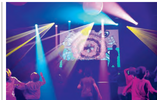
Turbo Minus

Venez partager un goûter avec nous et participer à l'atelier paillettes avant d'aller danser au VIP!