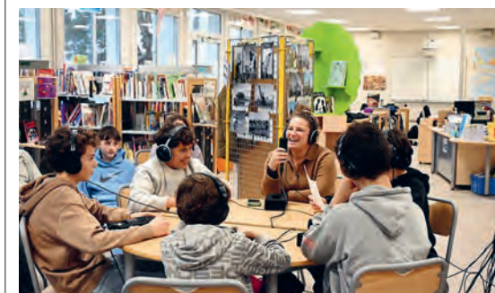
Projet podcast sur les handicaps invisibles autour du spectacle Personne n'est ensemble sauf moi , au collège Jean Moulin – Cie Amonine – mars 2026.

La saison dernière plus de 9700 élèves sont venus assister à un spectacle ou à une séance de cinéma. Ce sont plus de 2500 jeunes qui ont été touchés par une action (atelier de pratique, rencontre avec des artistes, visite du Théâtre...) ce qui représente 190 heures dédiées à l'éducation artistique et culturelle.