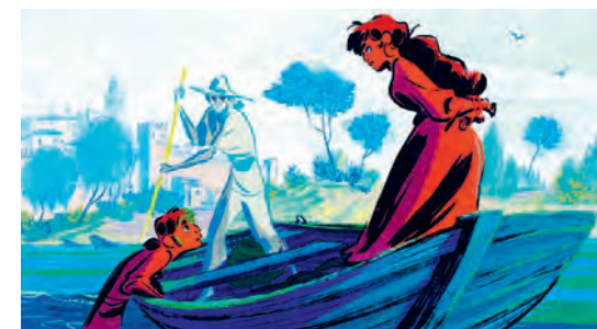
Carmen, l'oiseau rebelle

Labellisé Jeune Public, le Cinéma Jacques Tati propose toute l'année une programmation à destination des plus jeunes présentée dans un programme spécial bimensuel. Chaque semaine, les enfants ont ainsi la certitude de pouvoir découvrir un film sur grand écran. Adaptée au rythme scolaire, cette programmation P'tits tati s'amplifie pendant les petites vacances scolaires en proposant deux séances par jour tous les jours et au moins une séance par jour pendant les grandes vacances.