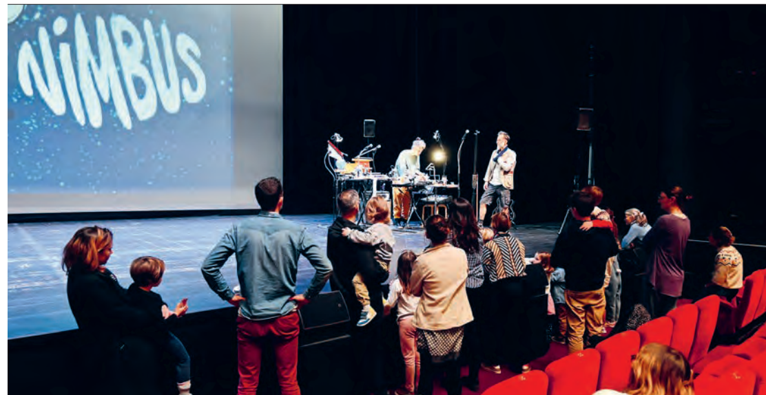
Atelier parents-enfants autour du spectacle Nimbus – novembre 2025.

Parce que nous sans vous, ça ne marche pas!