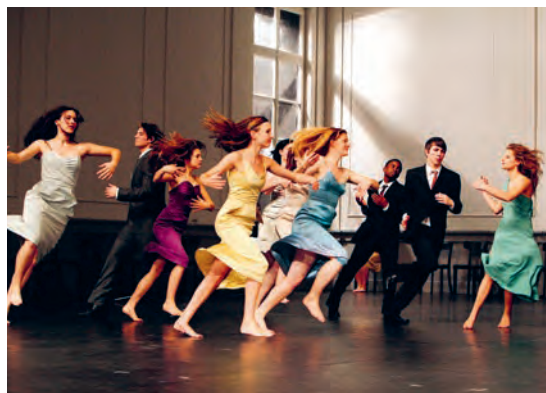
Les rêves dansants, sur les pas de Pina Bausch

• Métamorphose des Collèges de l'Artois (2021) Le film revisite les thématiques de la pièce Métamorphose de Sylvain Groud avec les interprètes du quatuor dansé et de jeunes collégiens de l'Artois. Production Ballet du Nord - CCN & Vous!